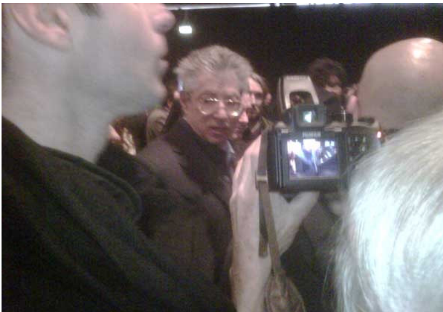
Da Bossi a Stanca, da Penati a Cantoni: chi c'era e chi no nel BlackPerri di Affari

L'inaugurazione ufficiale ci sarà oggi 6 febbraio a Cassano Magnago, alla presenza delle autorità locali e nazionali e di numerosi ospiti che hanno ribadito l'importanza e la necessità dell'opera per la crescita e lo sviluppo del territorio. Un'opera che, hanno ricordato tutti, sarà realizzata nel pieno rispetto dell'ambiente circostante e che, grazie a 150milioni di euro di compensazione ambientale, porterà, oltre alle strade, anche nuovi boschi e un milione di nuovi alberi.