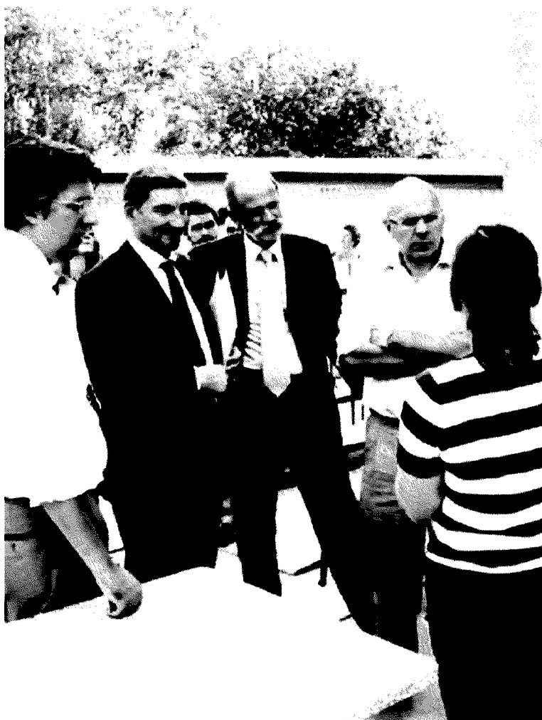
L'ultima tappa del tour brianzolo di ieri dei vertici di Pedemontana