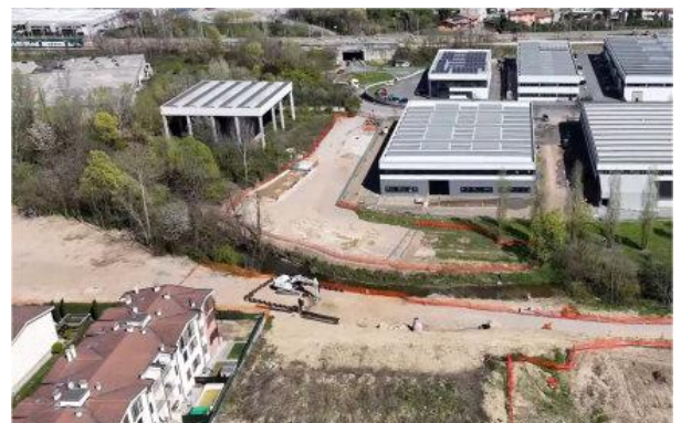
ATTIVITÀ DI INFISSIONE PALANCOLE SULLA SPALLA A DEL PONTE IN VIA PRATI

A Barlassina sono in corso interventi puntuali e opere connesse, come cantierizzazioni localizzate, gestione di sottoservizi e adeguamenti della viabilità locale. In particolare, nel territorio