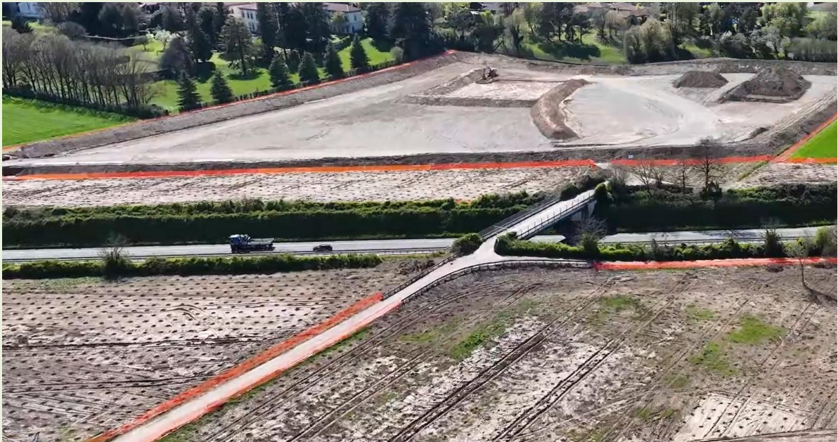
DEPOSITO TERRE DI VIA APPENNINI.

In via Appennini è stato realizzato il deposito terre n.5 della tratta B2; è un'area funzionale al deposito provvisorio delle terre che provengono esclusivamente dagli scavi del cantiere di Autostrada Pedemontana Lombarda per il successivo riutilizzo o smaltimento in cava. Infine, da via Mirabello fino a via Tonale sono in corso le attività di spostamento della rete Gas n.020/B2, interferente con il nuovo tracciato autostradale, a cura di imprese incaricate da SNAM.