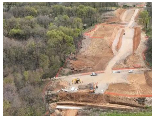
ATTIVITÀ DI SCAVO DELLA GALLERIA ARCORE 2

Ad Arcore i cantieri riguardano gallerie artificiali e opere coordinate con la rete ferroviaria e la viabilità esistente , in un contesto infrastrutturale complesso. Le principali attività di cantiere sono gli scavi, che richiedono una grande presenza di mezzi a causa della movimentazione del terreno 4 .