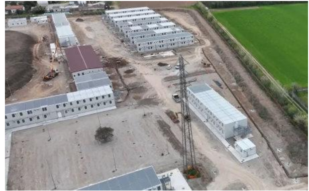
LAVORI DI REALIZZAZIONE DEL CAMPO BASE A DESIO

Nel comune di Desio i cantieri interessano gallerie artificiali e opere di scavalco . Inoltre, è stato completato il campo base operativo, che ospiterà il personale di cantiere e sarà il punto di riferimento per il coordinamento di numerose attività sul territorio.