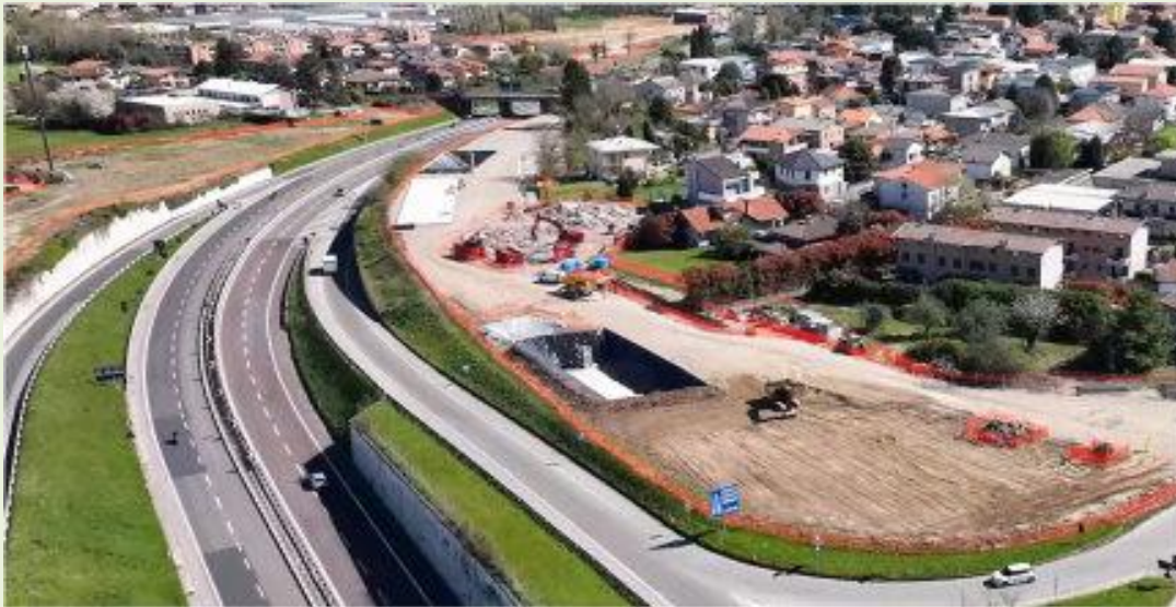
CANTIERIZZAZIONE RAMPA PISTA A SVINCOLO DI LENTATE.

Nel territorio di Lentate sul Seveso gli interventi riguardano prevalentemente le attività di bonifica , gli scavi e le opere in corrispondenza dello svincolo , con una gestione puntuale delle interferenze con sottoservizi, demolizioni e viabilità locale. In particolare, sono iniziate le attività di realizzazione del muro di sostegno MU34 sulla rampa del futuro nuovo svincolo di Lentate e procedono le attività di smaltimento delle macerie derivanti dalle demolizioni dei fabbricati preesistenti, in prossimità dell'attraversamento della SP35 Statale dei Giovi.